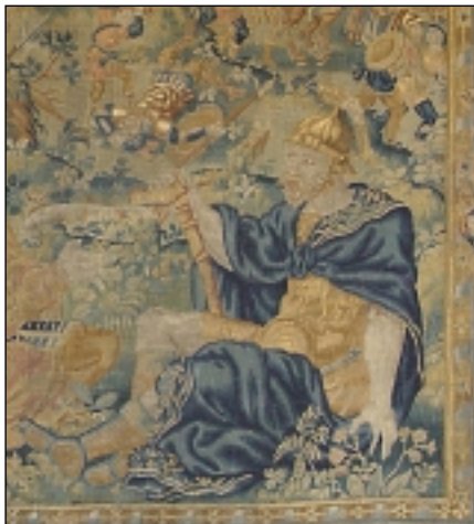
Umírající Herkules – ústřední postava renesančního gobelínu (detail).

Do slavkovského zámku se v závěru roku 2003 vrátil po 5 letech náročných restaurátorských prací renesanční gobelín z přelomu 16. a 17. století. Toto více než 400 let staré dílo mělo velmi pohnutý osud a za vydatné finanční podpory ministerstva kultury bylo zachráněno doslova „z popela“ (více na str. 5 zpravodaje). Pracovníci Historického muzea si uvědomují velký význam záchranu kulturního dědictví našich předků a připravili pro všechny zájemce na 17. hodinu ve čtvrtek 1. dubna vernisáž nově vystaveného renesančního gobelínu v zámecké expozici, při níž se můžete dovědět mnoho zajímavostí. (HM)