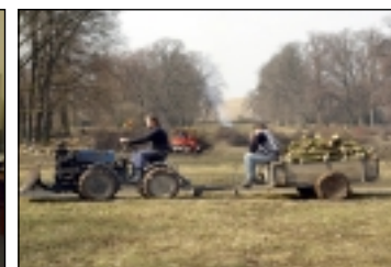
Jarní práce v zámeckém parku