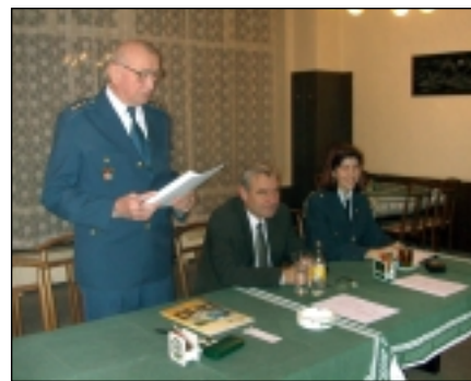
Výroční valná hromada hasičů.

To mi připomíná ještě jednu věc. Blíží se jaro a zase budou suché trávy na mezích a v sadech.