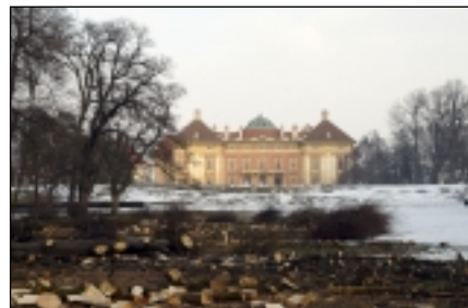
Práce na odstranění náletových dřevin.

ky, komponované programy na zámku i v parku při různých kulturních událostech (Napoleonský den, Výročí bitvy, vstup do EU, Den evropského kulturního dědictví, Vánoce na zámku, Dětské dny pro MŠ i oba stupně základních škol). Ve spolupráci se zkušenými firmami nabízíme populární akce, jakými jsou například festival populární písní Slavkov 2004 nebo setkání automobilů veteránů Oldtimer festival. V duchovní rovině se odehrává ekumenické setkání církví a široké veřejnosti při Slavkovských dnech smíření. Často využíváme vstřícné spolupráce se