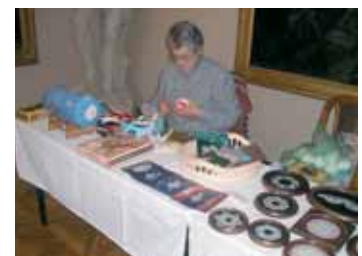
Ukázka řemeslné práce