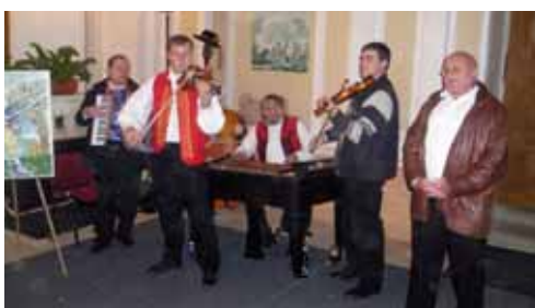
Cimbálová muzika Donava