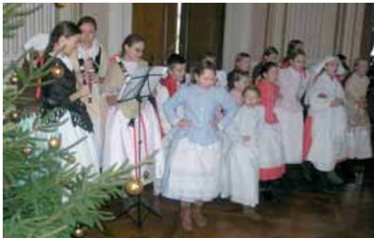
Vystoupení dětského folklorního souboru Křenováček