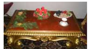
Adventní výzdoba zámku