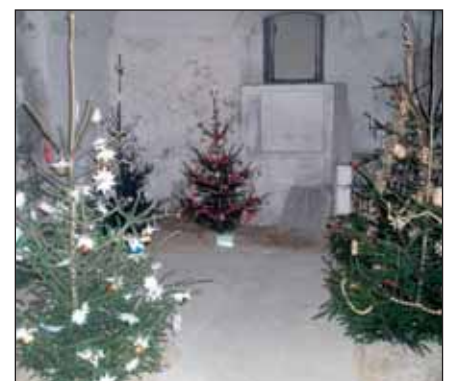
Stromky v podzemí zámku

Historické muzeum ve Slavkově u Brna Město Slavkov u Brna