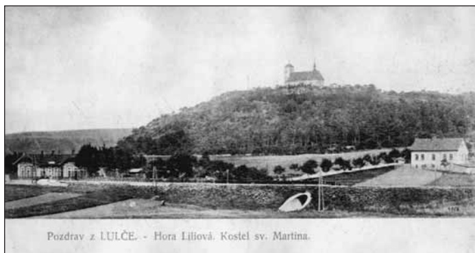
Pozdrav z LULČE. - Hora Liliová. Kostel sv. Martina.

Pohled na Luleč s kostelem sv. Martina z poč. 20. století