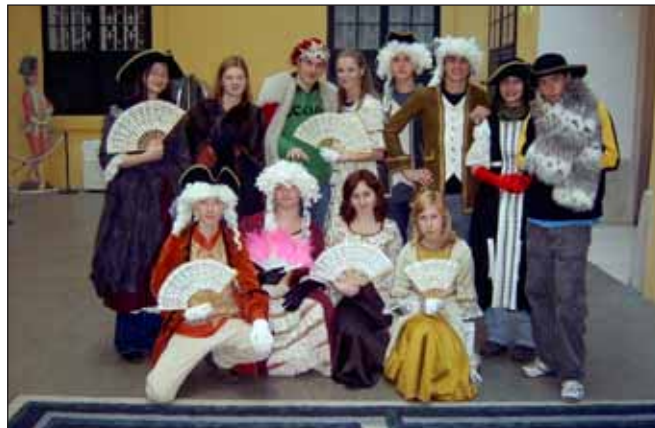
Móda minulých století