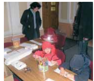
Dětské soutěže na zámku