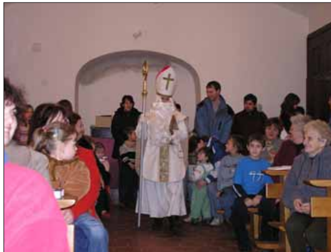
Z Mikulášské nadílky 5. prosince v kostele