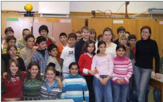
Ve škole ve Vídni