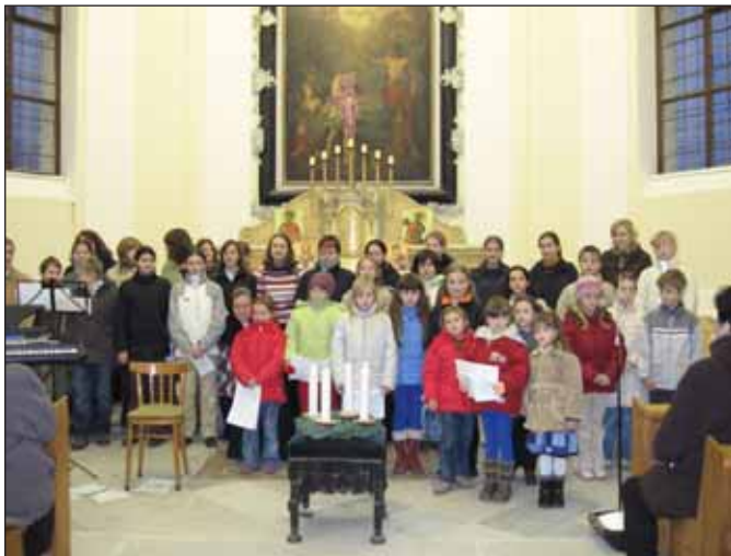
Adventní zpívání dětských schol 3. prosince v kostele sv. Jana Křtitele na Špitálce