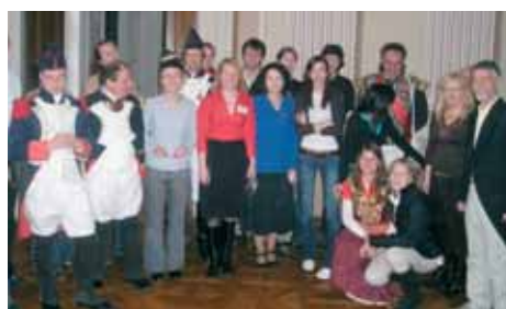
Divadelní soubor Gymnázia na Křenově, Brno