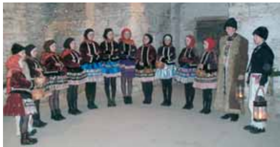
Vystoupení folklorního souboru Skoroňáček v podzemí zámku