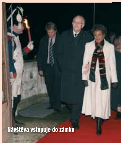
Návštěva vstupuje do zámku