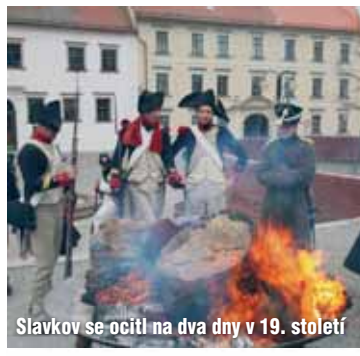
Slavkov se ocitl na dva dny v 19. století