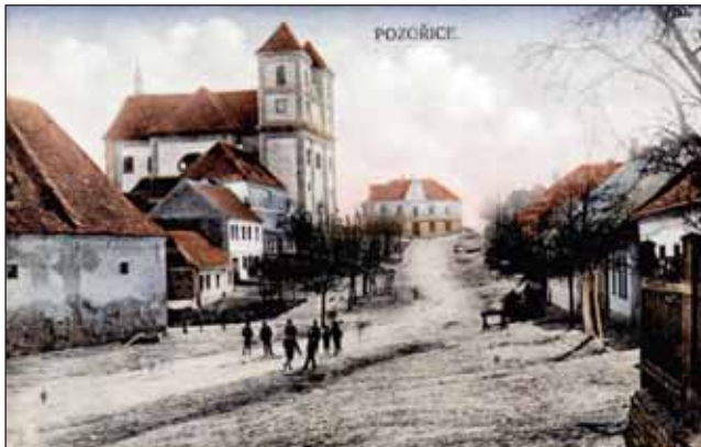
Pohled na náměstí v Pozořicích – I. pol. 20. století