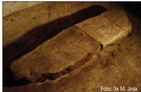
Obě části smírčího kamene po převozu a očištění