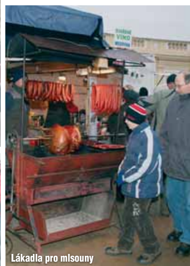
Lákadla pro mlsouny