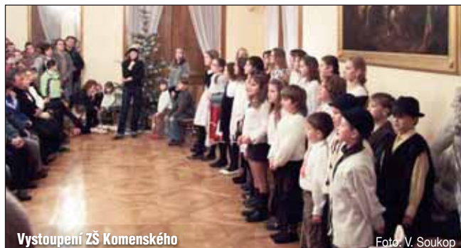
Vystoupení ZŠ Komenského