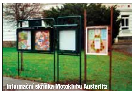
Informační skříňka Motoklubu Austerlitz

Rok 2008 se chýlí ke konci, a tak končí i motokářská sezona. Poslední akce motokářů je jako každý poslední den v roce tzv. Vánočka. Spanilá jízda majitelů motorek ulicemi Slavkova a blízkého okolí. Počet účastníků je velice závislý na počasí. Snad nebude náledí?