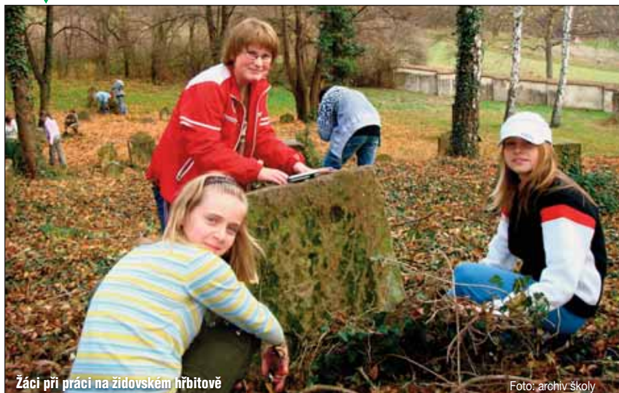
Žáci při práci na židovském hřbitově