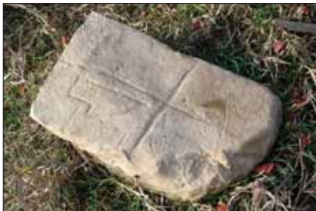
Odlomená nadzemní část smírčího kamene