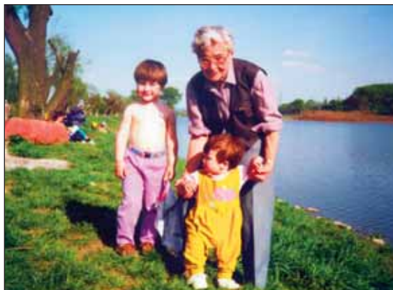
U slavkovského rybníka s vnučaty