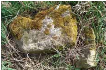
Neopracovaná strana kamene – v tomto stavu byl nalezen