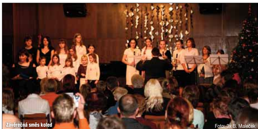
Závěrečná směs koled