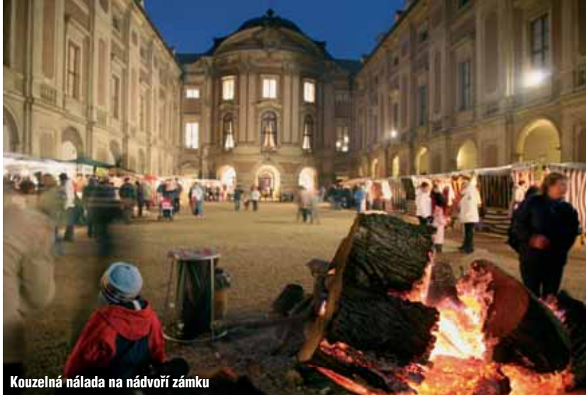
Kouzelná nálada na nádvoří zámku