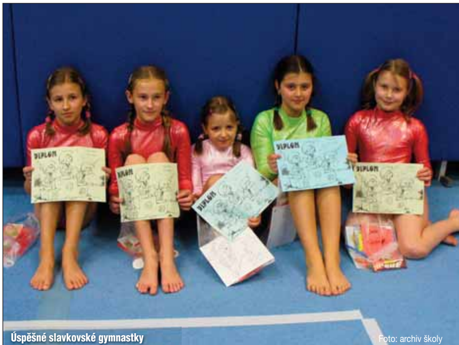
Úspěšné slavkovské gymnastky