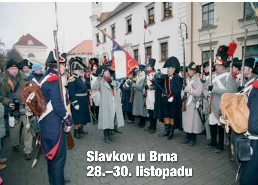
Slavkov u Brna 28.–30. listopadu