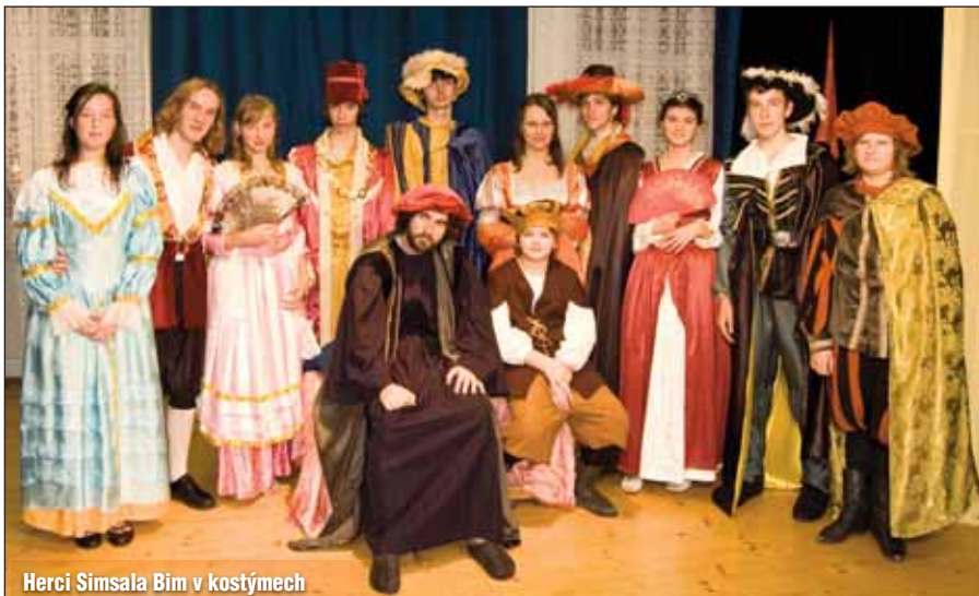
Herci Simala Bim v kostýmech

Na opětovné setkání s vámi se těší Simalabimáci. In