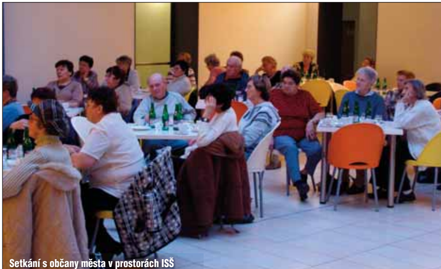
Setkání s občany města v prostorách ISS