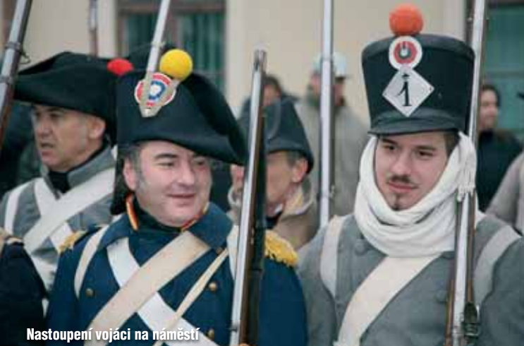
Nastoupení vojáci na náměstí