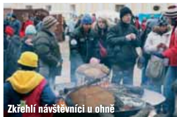
Zkřehlí návštěvníci u ohně