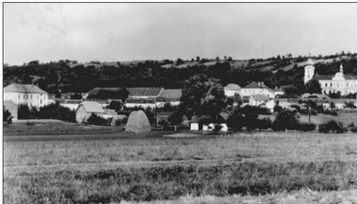
Dálkový pohled na Pustiměř – odesláno 29. 8. 1939