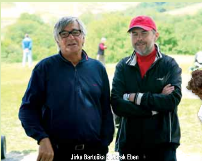
Jirka Bartoška a Marek Eben