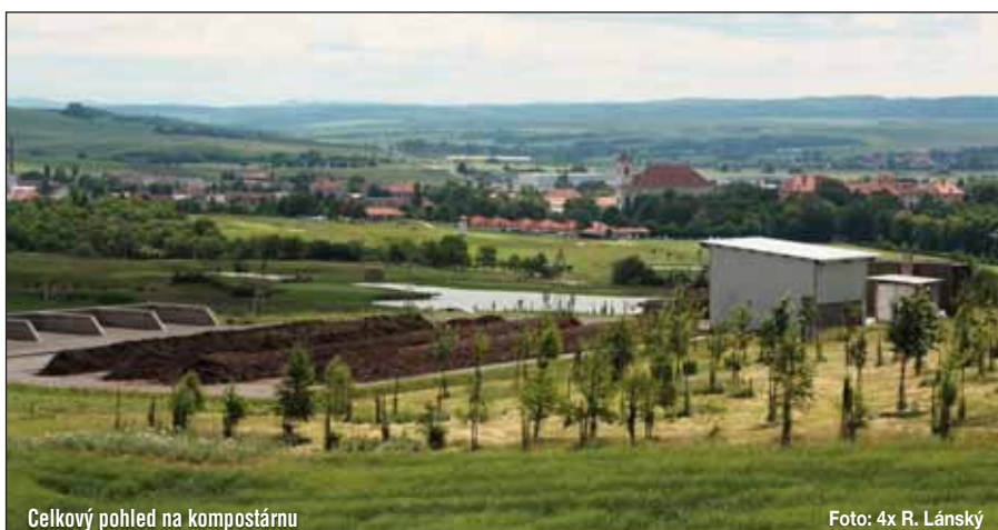
Celkový pohled na kompostárnu

Společnost RESPONO, a.s. prostřednictvím své dceřiné společnosti REBIOS, s.r.o. připravuje ve Vyskově výstavbu bioplynové stanice pro zpracování bioodpadů. Stanice by měla být v provozu od roku 2011. Pro Slavkov to znamená, že ve městě budou rozmístěny nádoby na sběr bioodpadů. Jedná se o speciálně upravené velké plastové „popelnice“. Do těchto nádob se bude dávat kuchyňský odpad z domácností jako jsou zbytky ovoce, zeleniny, pečiva, masa, kostí, skořápky od vajec apod. Zapojení do tohoto systému musí schválit zastupitelstvo města. I při zavedení tohoto systému odpad ze zeleně (listí, trávu, větve) budou dále svážet technické služby na kompostárnu. Ing. Pavel Janeba, odbor ŽP