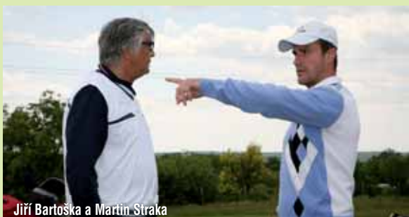
Jiří Bartoška a Martin Straka