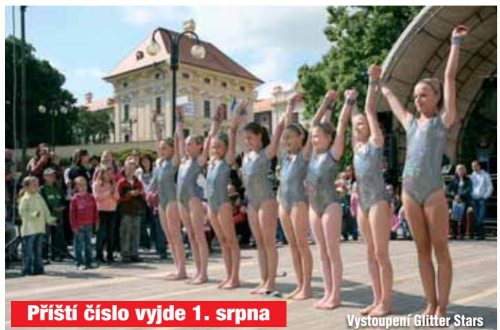
Příští číslo vyjde 1. srpna