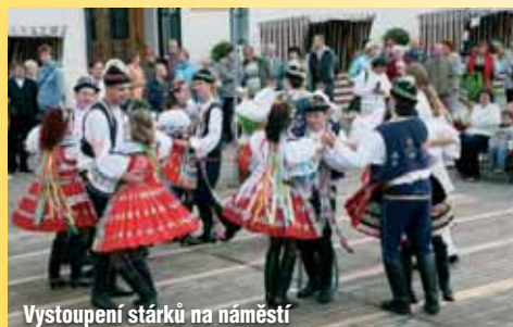
Vystoupení stárků na náměstí