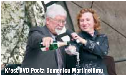
Křest DVD Pocta Domenicu Martinellimu