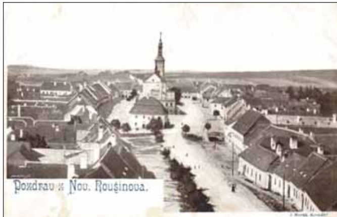
Pohled na Nový Rousínov – dopisnice poč. 20. století