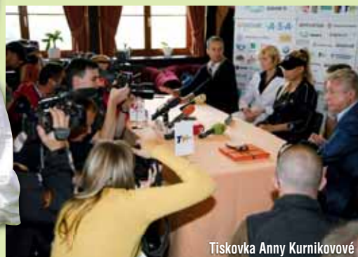
Tiskovka Anny Kurnikové

Anna Kurniková se předtím zúčastnila na tiskové konferenci, na které odpovídala na dotazy přítomných novinářů a chystala se na zahájení golfového turnaje.