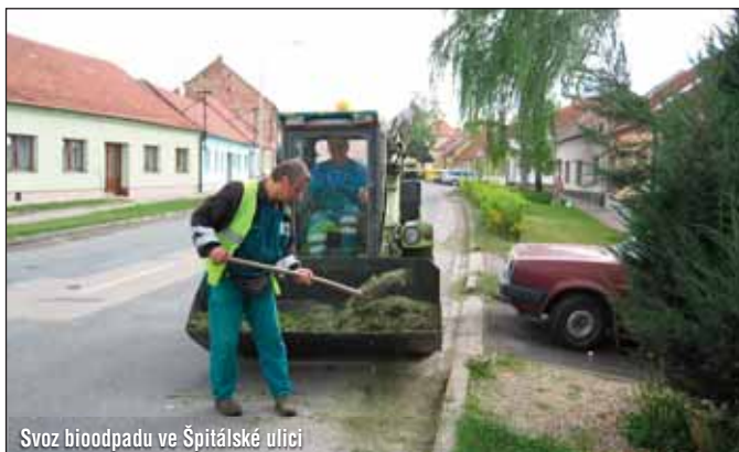
Svoz bioodpadu ve Špitálské ulici