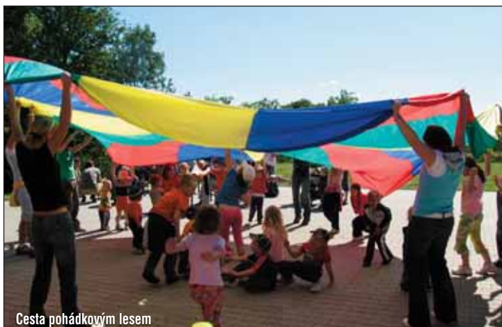
Cesta pohádkovým lesem