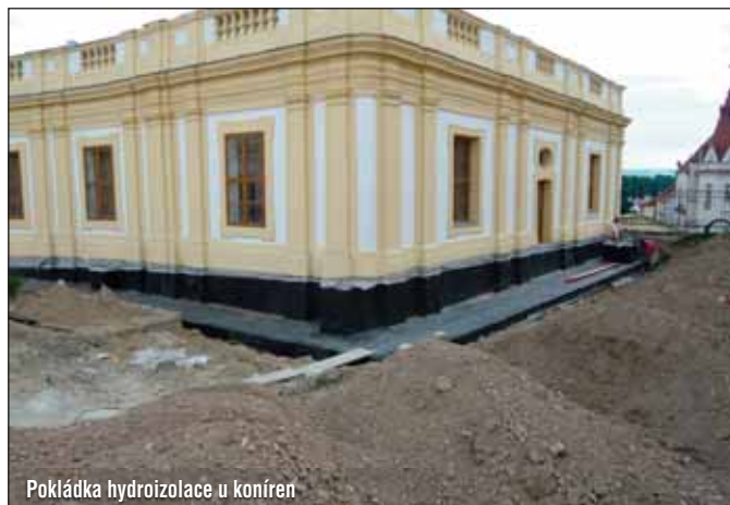
Pokládka hydroizolace u koníren