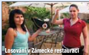
Losování v Zámecké restauraci