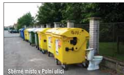
Sběrné místo v Polní ulici