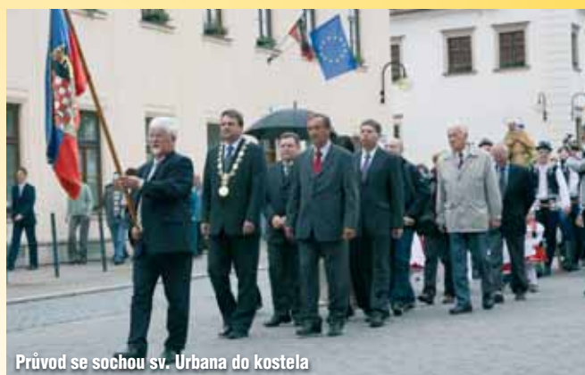
Průvod se sochou sv. Urbana do kostela