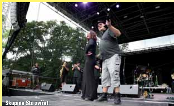
Skupina Sto zvířat