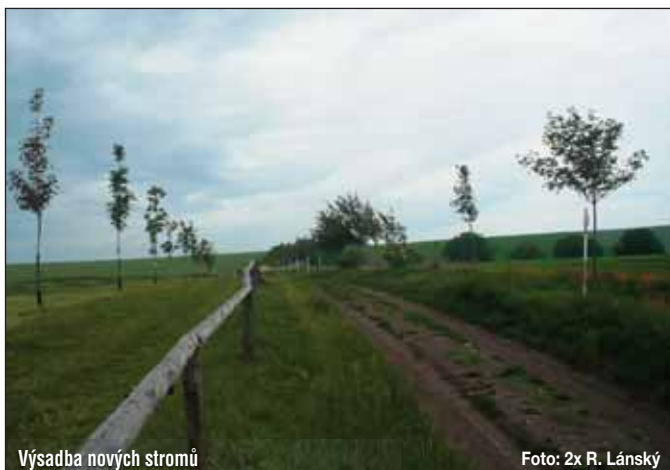
Výsadba nových stromů