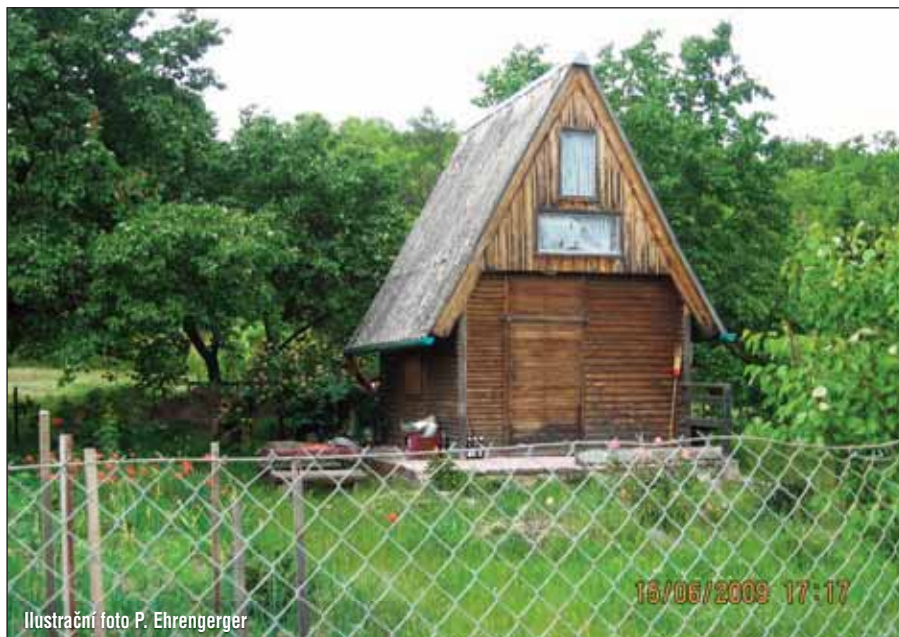
Ilustrační foto P. Ehrengerger

Společnost RESPONO, a.s. oznamuje, že ve státní svátek – v pondělí 6. července provede pravidelný svoz komunálního odpadu dle svozového plánu. Nezapomeňte přistavit popelnice!