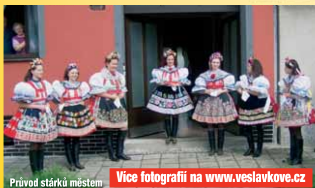
Průvod stárků městem