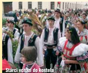
Stárci vcházejí do kostela