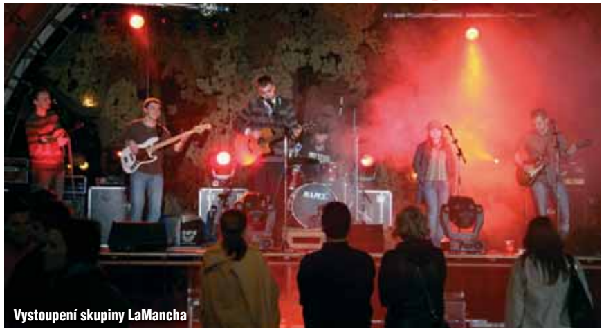
Vystoupení skupiny LaMancha