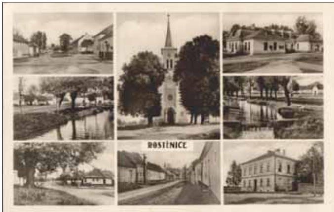
Pohledy na obec Rostěnice – 1. pol. 20. století