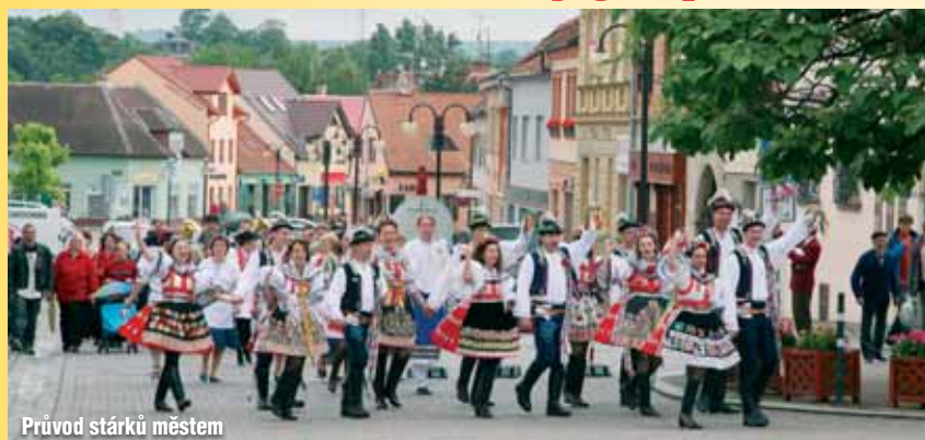
Průvod stárků městem