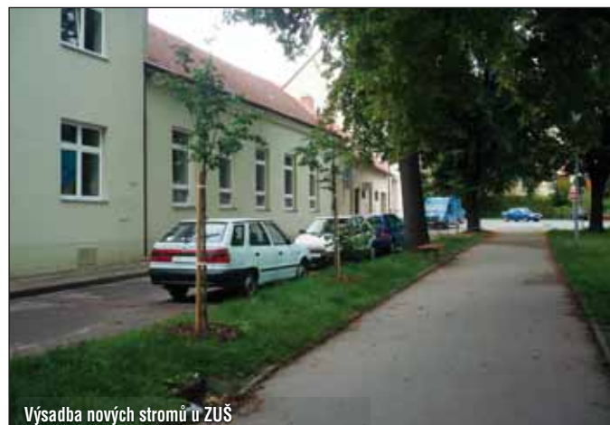
Výsadba nových stromů u ZUŠ