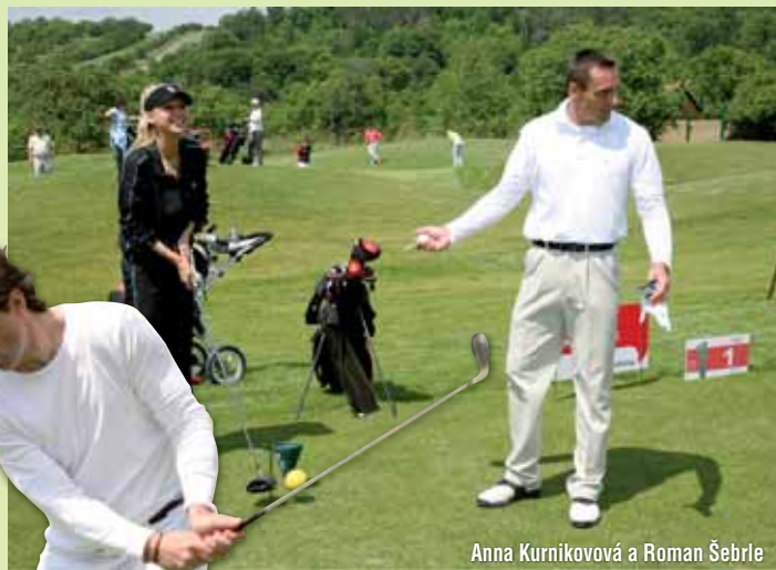
Anna Kurniková a Roman Šebrle