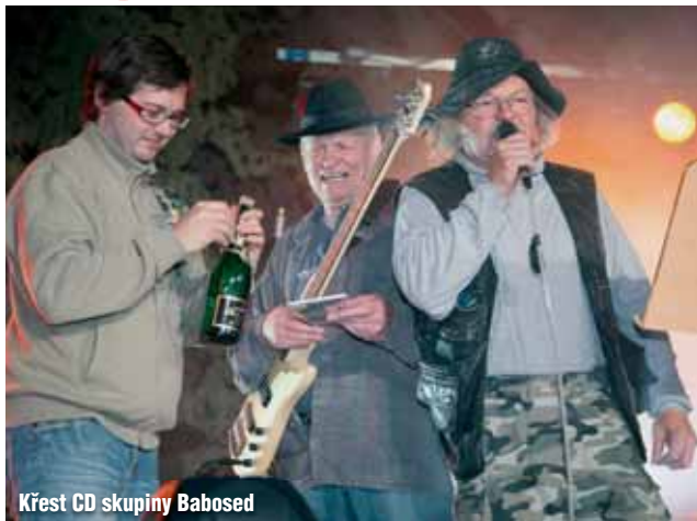
Křest CD skupiny Babosed