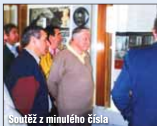
Soutěž z minulého čísla

Vyhodnocení soutěže z minulého čísla: na obrázku byl bývalý chilský prezident Augusto Pinochet (celým jménem Augusto José