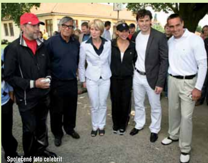
Společné foto celebrit