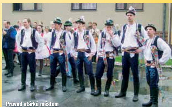
Průvod stárků městem