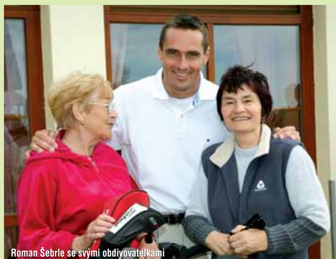
Roman Šebrle se svými obdivovatelkami