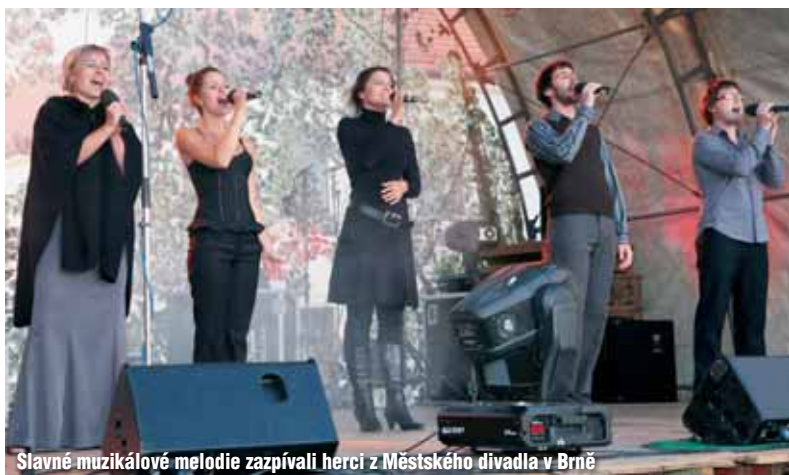
Slavné muzikálové melodie zazpívali herci z Městského divadla v Brně