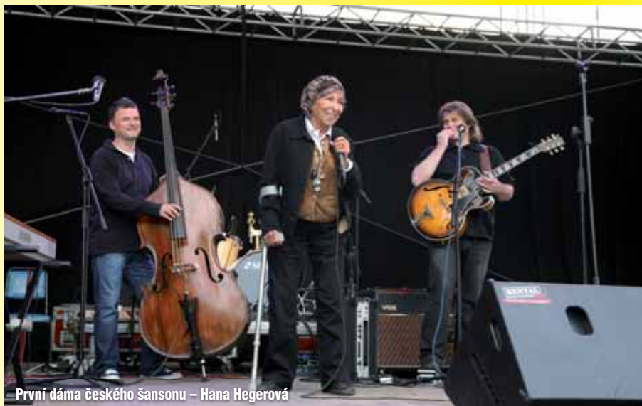
První dáma českého šansonu – Hana Hegerová